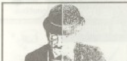
Dos audifonos son mejores que uno solo.